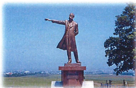
クラーク像（札幌羊が丘展望台）

酪農学園大学は、札幌の近郊、江別市にあり、札幌からは電車で 15 分ほどの自然豊かな場所にあります。また、7 月の初めは季節的にも大変良い時期になります。是非、酪農学園で開催される動物看護学会に出席頂き、学会も北海道の自然も楽しんでリフレッシュして頂けたらと思います。皆様の出席を教員一同お待ちしております。